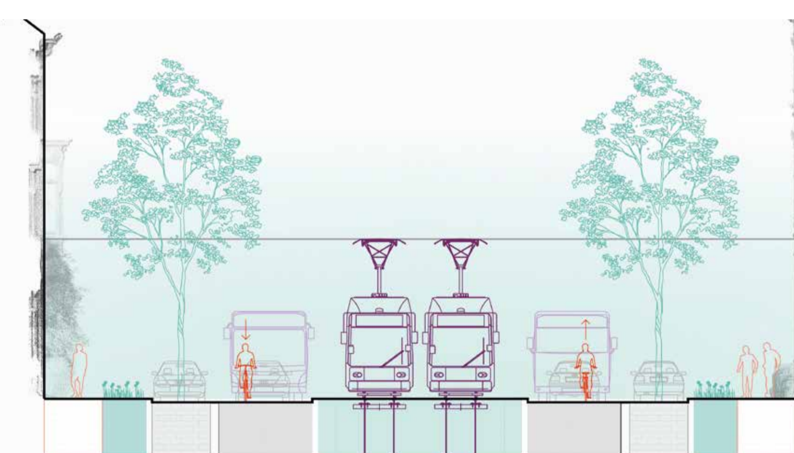
Voorkeur: gemengd verkeer